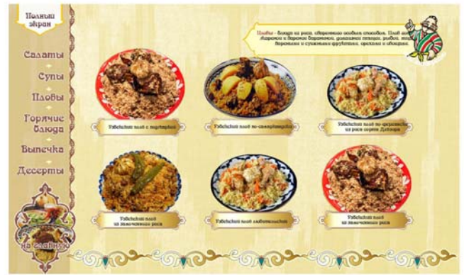
Это страница двух рецептов: